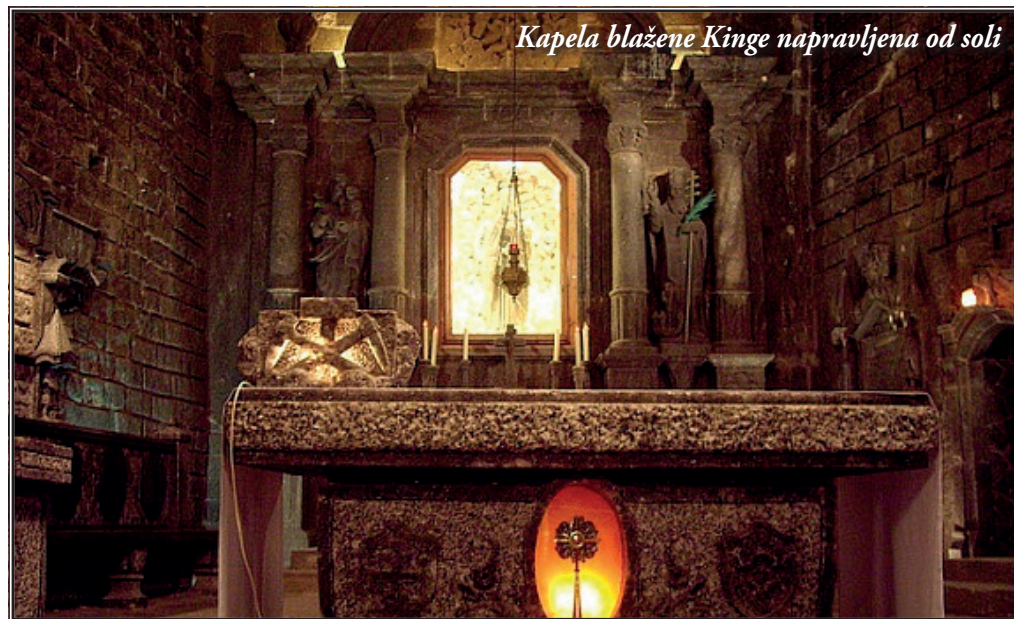
Kapela blažene Kinge napravljena od soli