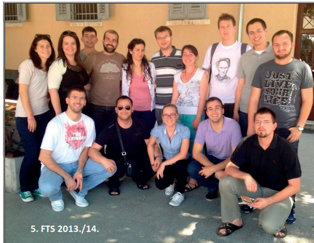
5. FTS 2013./14.